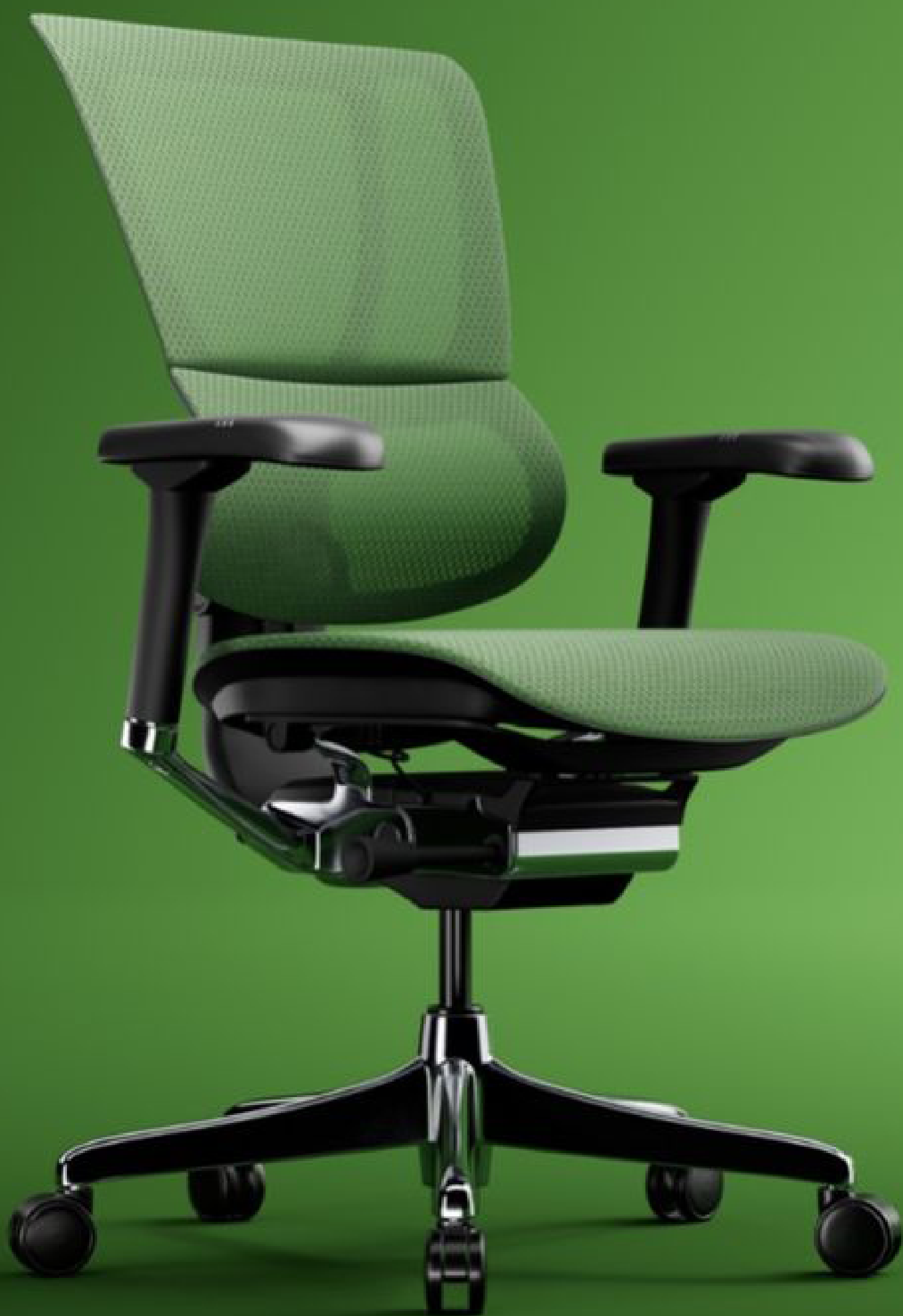
Línea - Sillas